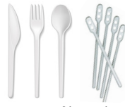
Kunststof bestek en roerstaafjes

Reden: Ze worden vaak in het zwerfafval gevonden en niet gerecycled in het huidige systeem.