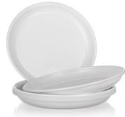
Kunststof borden (PS)