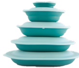
Herbruikbare borden en containers