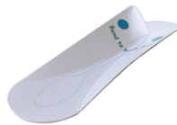
Papier en karton